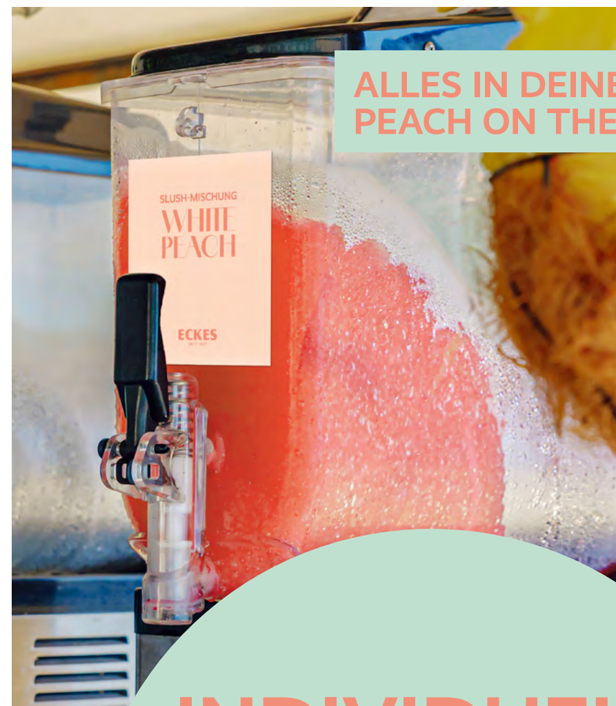
ALLES IN DEINEM ECKES PEACH ON THE BEACH BUNDLE