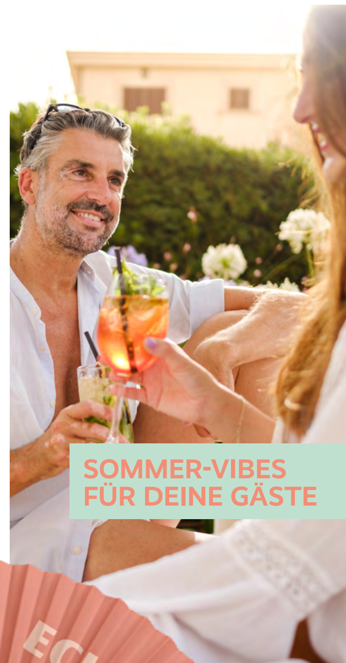
SOMMER-VIBES FÜR DEINE GÄSTE