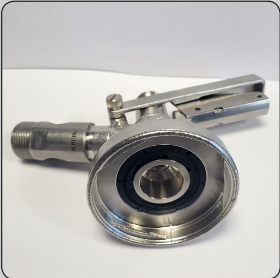
Dreikantfitting – Dreikant-Flachzapfkopf Typ-G